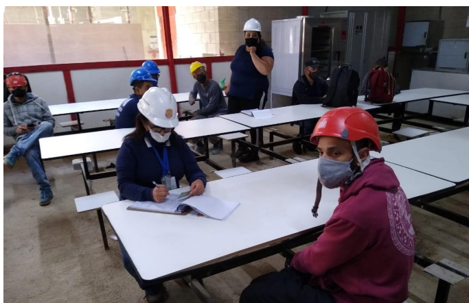
TRABALHADOR QUE FOI DEMITIDO POR DENUNCIAR EMPRESA É RECONTRATADO