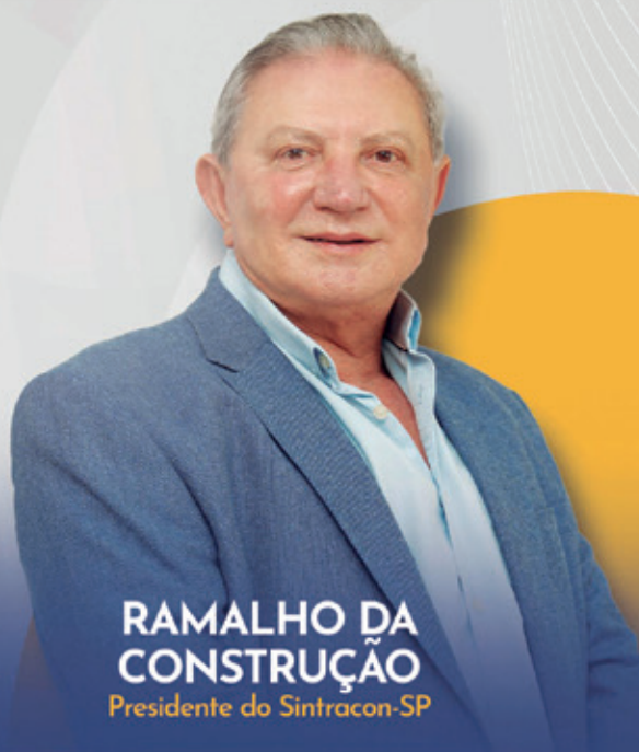
RAMALHO DA CONSTRUÇÃO Presidente do Sintracon-SP