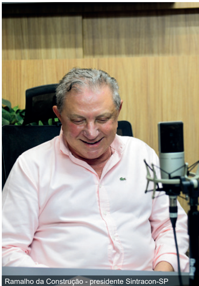
Ramalho da Construção - presidente Sintracon-SP

participação dos trabalhadores no fortalecimento das entidades sindicais. Em um cenário de mudanças, informação e organização são fundamentais para garantir conquistas e evitar retrocessos.