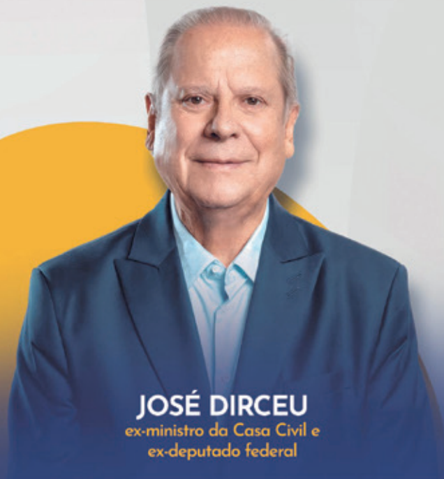
JOSÉ DIRCEU ex-ministro da Casa Civil e ex-deputado federal

A evolução do movimento sindical brasileiro e perspectivas atuais