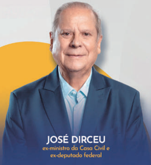
JOSÉ DIRCEU ex-ministro da Casa Civil e ex-deputado federal

A evolução do movimento sindical brasileiro e perspectivas atuais