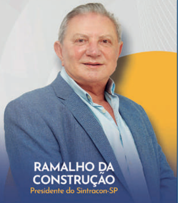
RAMALHO DA CONSTRUÇÃO Presidente do Sintracon-SP